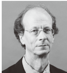
日産現代日本研究所 オックスフォード大学 セント・アンドニーズ・カレッジ教授